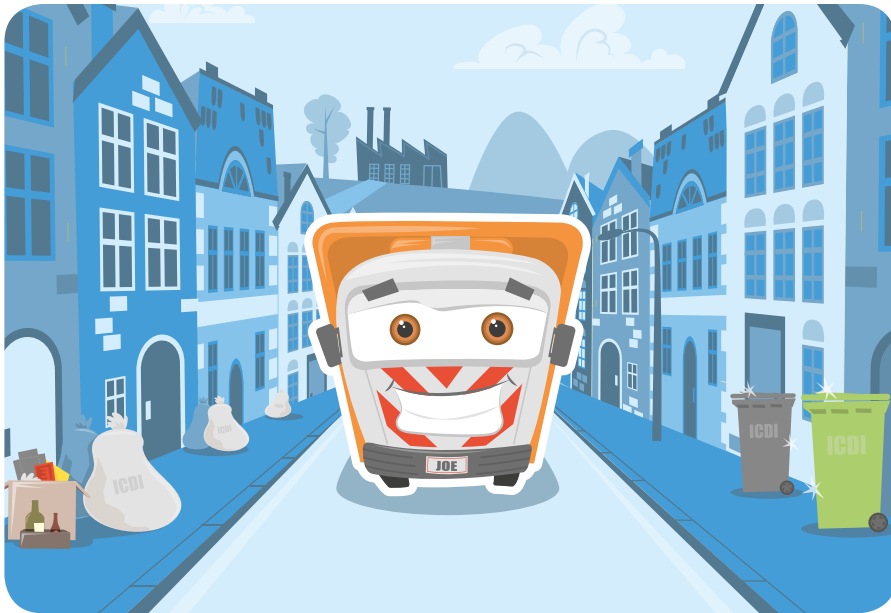
Illustration: Mathieu Lepoutre

E n prenant le contre-pied d'un cours magistral qui endormirait un hibou, les animations proposées par l'équipe « Prévention des déchets » de l'ICDI relèvent un défi de taille. Celui d'expliquer aux enfants, de manière ludique et amusante, les bons gestes pour préserver la planète et notre environnement.